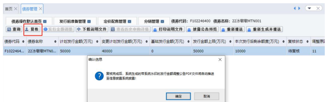
图 12 簿记系统-发行金额调整界面