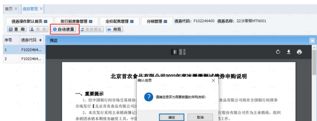
图 9 簿记系统-申购说明自动披露预览界面