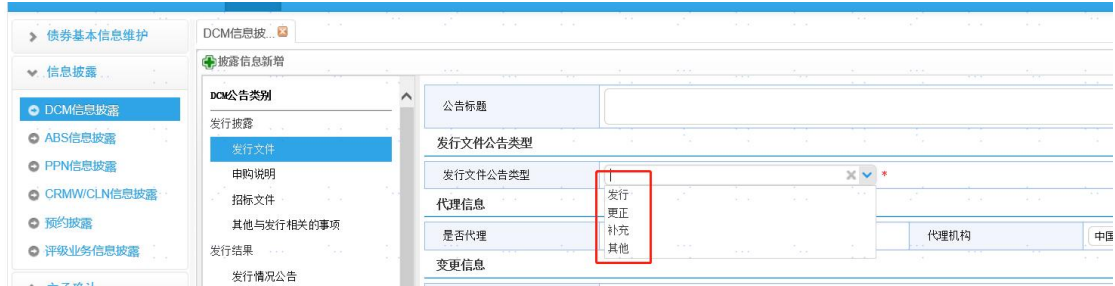
图 3 信披系统-发行文件公告类型界面

1、完善发行文件公告分类，新增“发行文件公告类型”。主承销商在“发行文件公告类型”处根据实际公告类型进行选择，区分发行文件、发行文件更正、发行文件补充材料及其他。