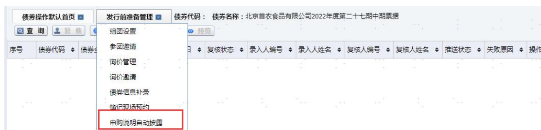
图 8 簿记系统-申购说明自动披露界面

- 【申购说明自动披露】 1 模块点击自动披露并在预览后提交，复核完成后簿记系统推送带系统水印版申购说明至信披系统自动披露。