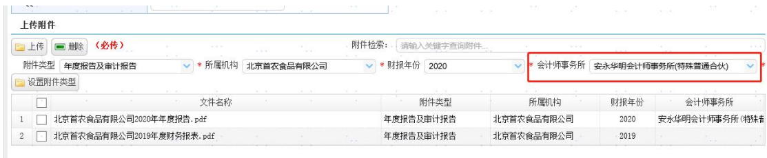
图 4 信披系统-会计师事务所选择界面

3、完善附件类型信息，新增“会计师事务所”字段，主承销商在【信息披露】-【发行文件】-“上传附件”处，上传发行人/发起机构/信用增进机构年度财务报告附件后，信披系统根据注册阶段数据自动填录会计师事务所信息，自动填录信息支持修改，修改结果长期有效。